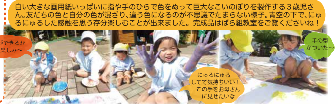
白い大きな画用紙いっぱい指や手のひらで色をぬって巨大なこのぼりを製作する3歳児さん。友だちの色と自分の色が混ざり、違う色になるのが不思議でたまらない様子。青空の下で、にゆるにゆるした感触を思う存分楽しむことが出来ました。完成品はばら組教室をご覧くださいね! 何ができるかお楽しみ~ 手の型がついた~ にゆるにゆるして気持ちいい!この手を母さんに見せたいな